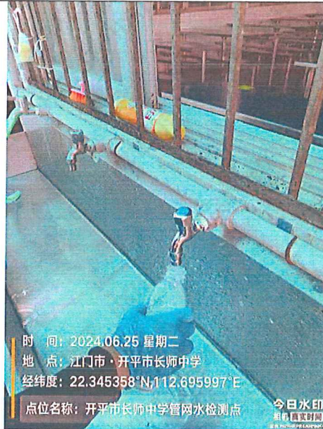
开平市长师中学管网水检测点